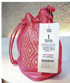
價錢牌上印有時裝與環境有關的數字，希望消費者明白「時尚何價」。

她補充指Green Ladies並非鼓吹消費，店內到處都有叫人三思的字句如「Second Thought」，價錢牌上印有衣物影響環境的數據，以沖淡購物欲：「曾有客人表示趕時間不試便買，職員便勸對方一定要試身，客人試身才發覺不合身，最後放棄購買。我們這樣做是希望消費者購物前要考慮清楚，以免買了不合適的衣物而造成浪費，增加廢物產生。」