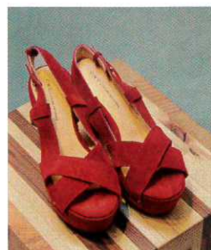
價錢牌還未除下的Costume National真皮涼鞋，售$228。